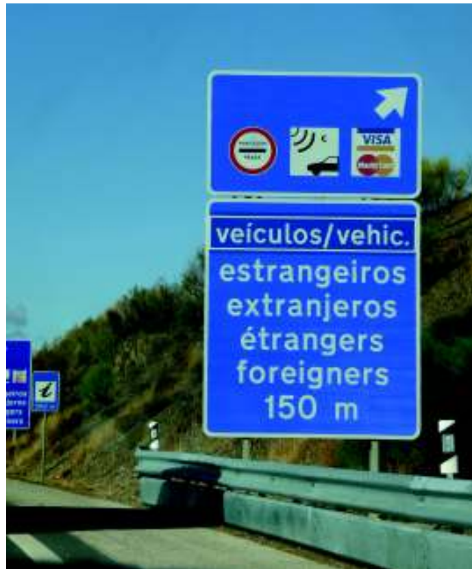
Imagen 5. Señal informativa en territorio portugués al cruzar la frontera con Ayamonte.

La elección lingüística de la oficialidad de Castro Marim es, además, solidaria de la emprendida en otra zona de la frontera: el área transfronteriza primera, en que se avisa del pago del peaje en un anuncio bilingüe en inglés / portugués (IMAGEN 4), y en una segunda posición se instala otro cartel, ya este multilingüe, con el español en segunda posición por debajo del portugués (acompañando al francés y el inglés, por este orden, IMAGEN 5).