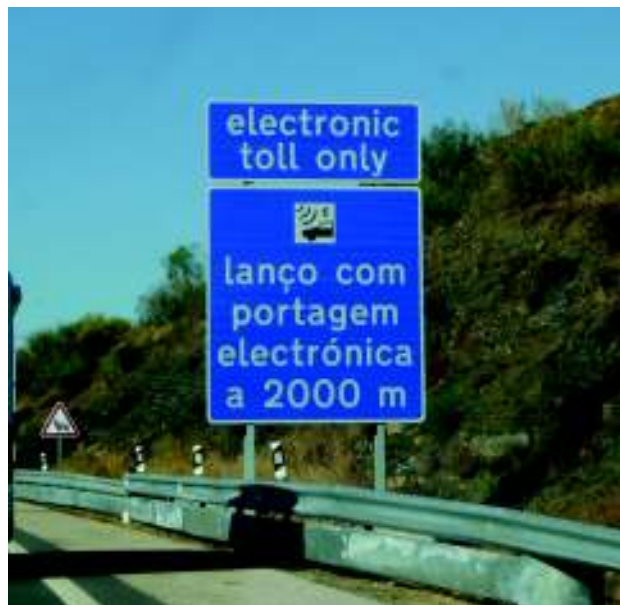
Imagen 4. Señal informativa en territorio portugués al cruzar la frontera con Ayamonte.

En la identidad externa de Castro Marim, lo hispánico no se da y hay una omisión clara del hecho fronterizo. Por ello, el comportamiento lingüístico de esta localidad coincide con el de otras localidades portuguesas que usan el inglés como lingua franca y no dan noticia apenas de español; así, como muestran Ribeiro Clemente et alii (2013: 128), en la localidad de Aveiro “Spanish appears only in multilingual signs”; Torkinton (2009) ni siquiera lo mencionaba en su estudio de la localidad de Almancil, en pleno Algarve.