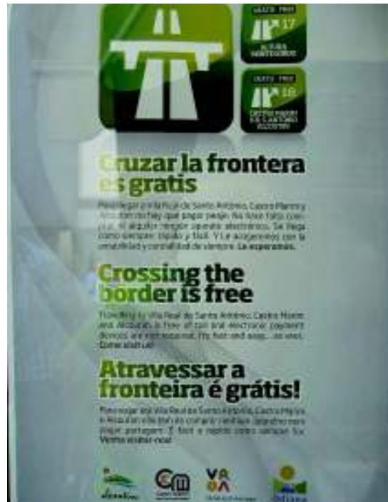
Imagen 6. Cartel fijado a escaparate de comercio en Rua Doutor Teófilo Braga. Vila Real de Santo António (Portugal).

gráfico: Muebles *em su casa hasta Sevilla ), sea para advertir de ciertas reglas de funcionamiento de la tienda (en ese caso en un cartel bilingüe: Quem partir paga / Quien parte paga ). Participa de esa situación también el bazar regentado por inmigrantes chinos y sito en la misma calle estudiada: rótulo principal en portugués y en el escaparate cartel manuscrito trilingüe en portugués / español (con errores: No *devolvemo el dinero hacemos cambio o *um vale , IMAGEN 8) / inglés.