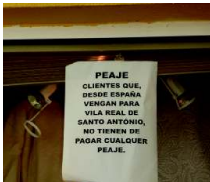
Imagen 7. Cartel fijado a escaparate de comercio en Rua Doutor Teófilo Braga. Vila Real de Santo António (Portugal).