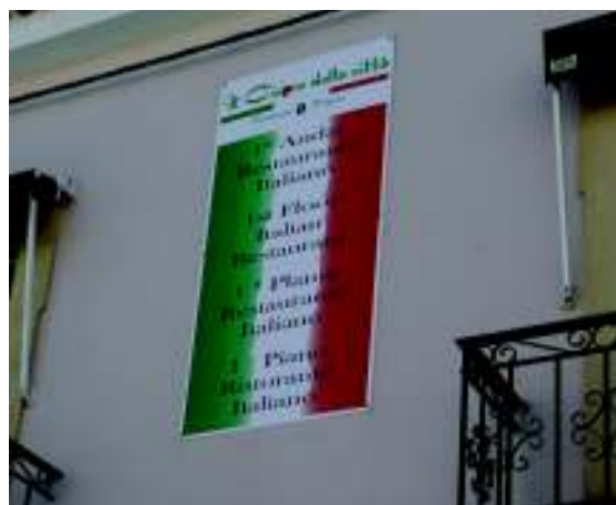
Imagen 9. Cartel fijado a fachada en Rua Doutor Teófilo Braga. Vila Real de Santo António (Portugal).