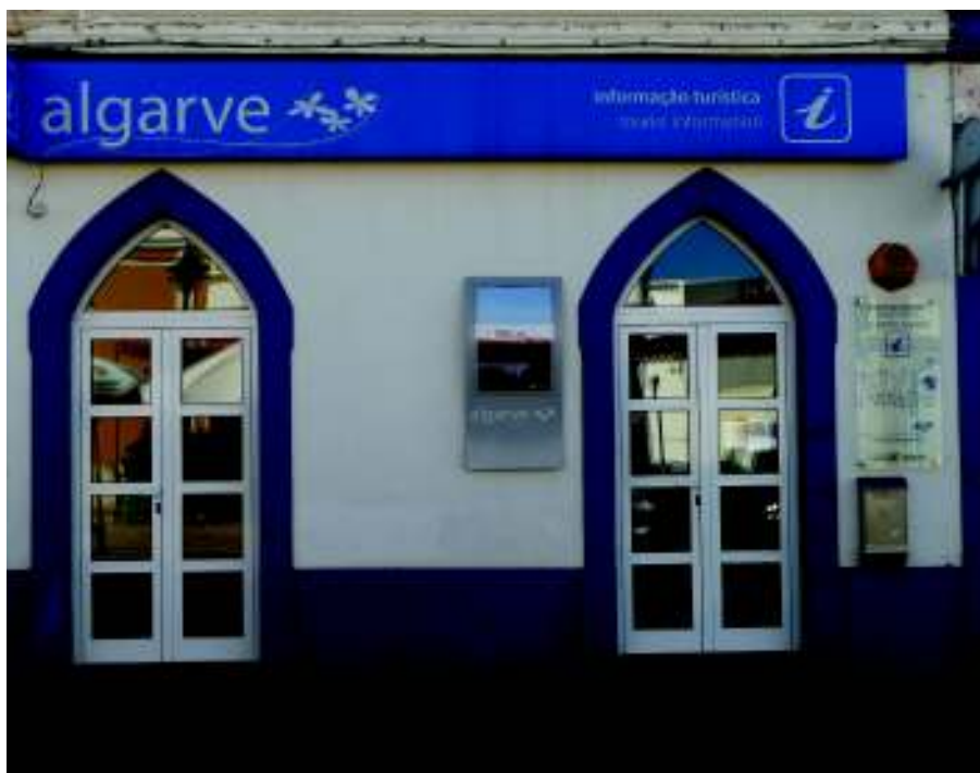
Imagen 1. Oficina de información turística. Rua Dr. José Alves Moreira. Castro Marim (Portugal).

Si bien el pueblo ha desarrollado tradicionalmente su economía en torno a la agricultura y la producción y venta de sal, el pintoresco casco histórico del pueblo, el Fuerte de San Sebastián, del siglo XVII y su castillo medieval de raíz templaria son lugares atractivos para las visitas turísticas. Ello está refrendado oficialmente por la instalación en este pequeño pueblo de una oficina turística en la que hemos podido gestionar la cuantificación de datos de los turistas que acuden allí a pedir información. Se constata una afluencia mayoritaria de turistas peninsulares a la localidad, sean nacionales (portugueses) o extranjeros (españoles), así como la concurrencia de colectivos europeos como ingleses, alemanes, holandeses y polacos a Castro Marim. Junto con la citada Oficina de Turismo, señalizaciones que indican el acceso al castillo así como la cartelería dentro del propio monumento confirman la atención que dentro de la signación institucional ( top-down signs ) se concede al sector del turismo.