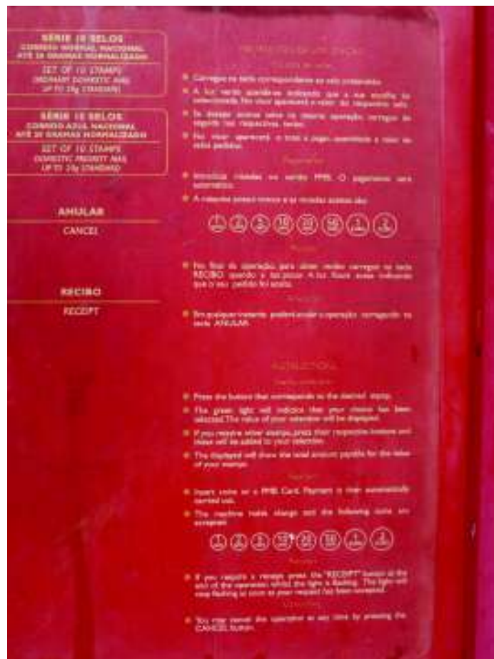
Imagen 10. Exterior de oficina de correos en Rua Doutor Teófilo Braga. Vila Real de Santo António (Portugal).

e. Por último, señalemos que la rotulación de tipo institucional o administrativa localizada en esa calle (único ejemplo de top-down sign con el que contrastar los resultados particulares previos) va en la misma línea del paisaje lingüístico comercial: la oficina municipal de correos (IMAGEN 10) rotula en portugués y secundariamente en inglés.