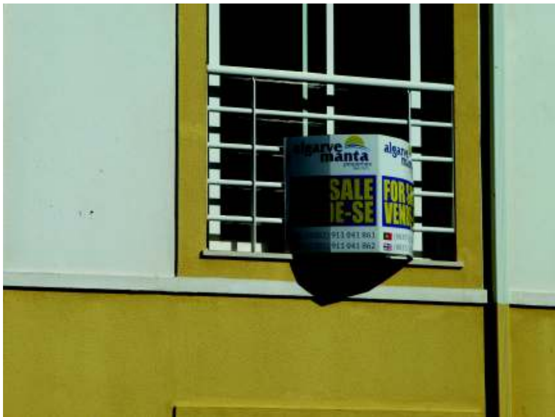
Imagen 3. Cartel de venta de casa por agencia inmobiliaria. Rua 26 de janeiro. Castro Marim (Portugal)

a. Ciertos negocios particulares que aspiran a recibir como clientes a los foráneos utilizan el par portugués / inglés en su rotulación. Así lo hace un despacho de abogados ( Escritório de advogados / Law office ) que suponemos pretende asesorar al turismo británico o alemán que se instala en la zona como parte del fenómeno de la gerontoinmigración que deja huellas por toda la costa andaluza. Por la misma razón, no faltan los carteles que avisan de la venta de inmuebles en rotulación bilingüe ( For sale / Vende-se , incluso con el inglés en primera y más saliente posición).