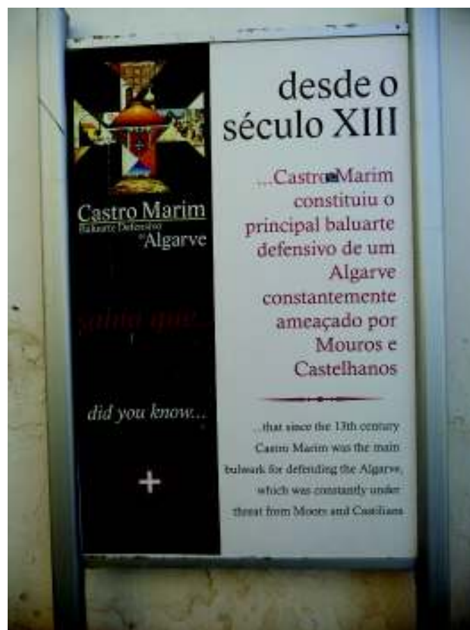
Imagen 2. Cartelería externa al castillo de Castro Marim. Castro Marim (Portugal).